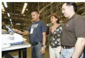
30 representantes de organizaciones políticas y los rectores del CNE participaron en la auditoría predespacho