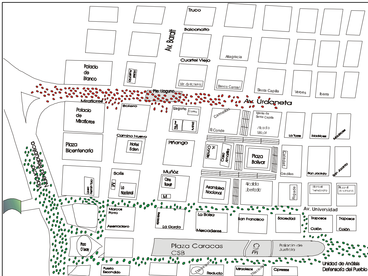
11 de abril de 2002. Concentraciones en el centro de Caracas