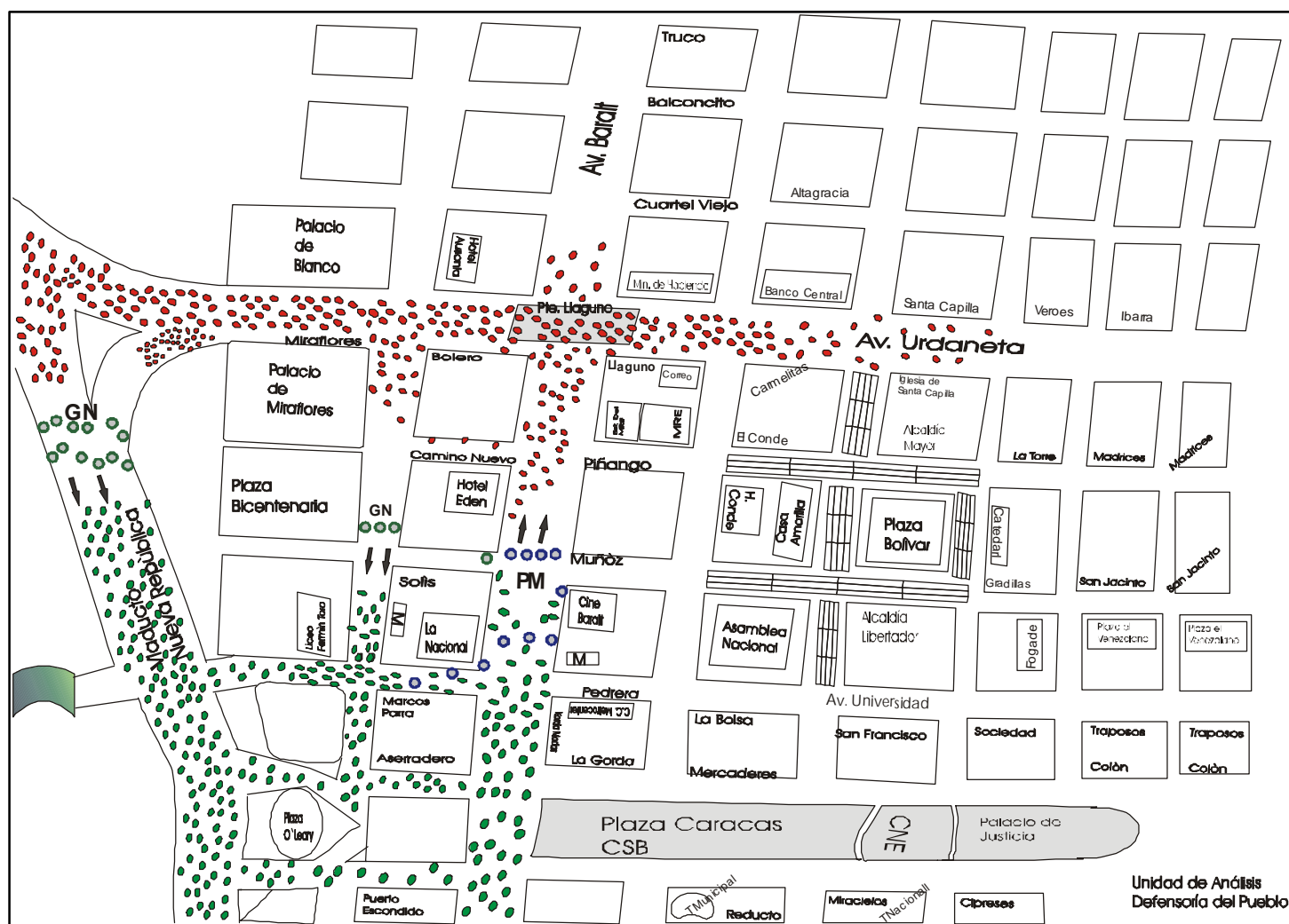
Croquis N° 4: Acción de los cuerpos de seguridad contra los manifestantes luego de la disolución de los cercos de la PM

Se desconocen las causas por las que fueron disueltos los cercos de la PM. En todo caso, una vez que esto ocurrió, la Guardia Nacional mantuvo los suyos para contener el avance de la marcha opositora por el viaducto Nueva República y por las esquinas de Solís a Marcos Parra; mientras la Policía Metropolitana enfrentaba a los partidarios del gobierno ubicados en la parte norte de la avenida Baralt.