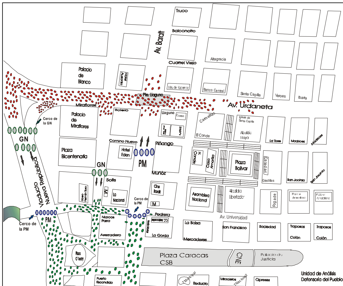
Croquis N° 3:

Acción de los cuerpos de seguridad contra los manifestantes al llegar la marcha de Chuao